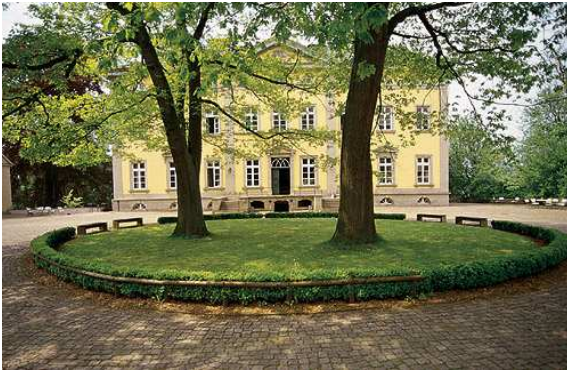
Tagungsstätte Haus Villigst